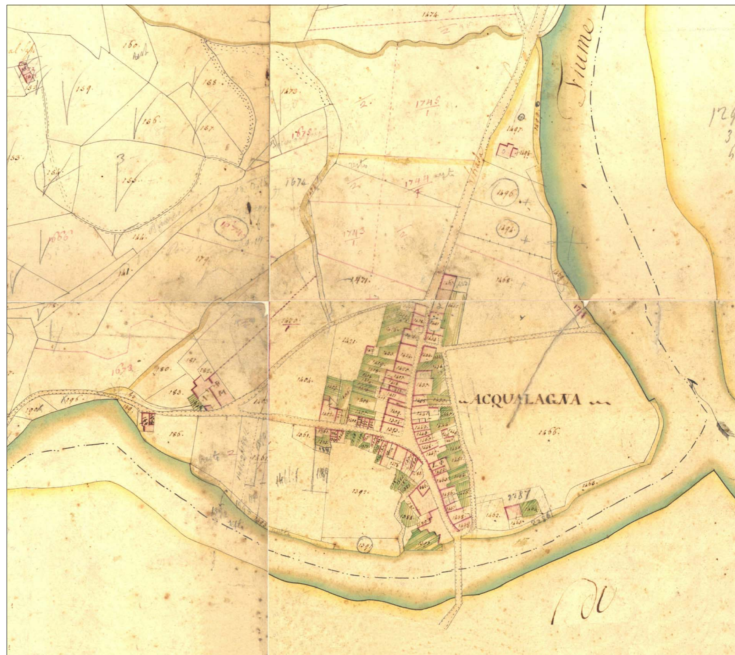
estratto Catasto Pontificio 1:2.000